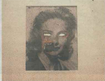
'Autorretrato de tú y yo', de Douglas Gordon.